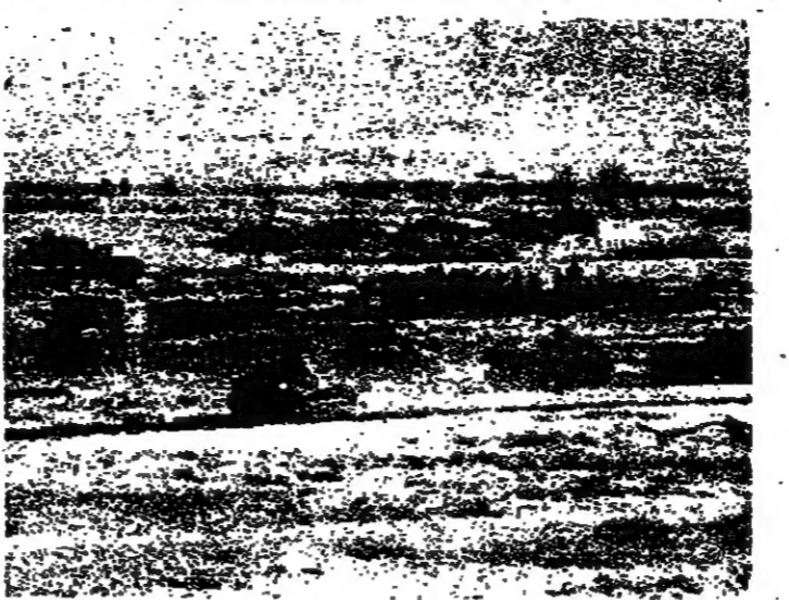
القوات السوفياتية في افغانستان

باختصار بعد مرور سبعة اشهر على عملية كابل ، لا يزال الوضع قائما حول مخزى العملية السوفياتية ونتيجة لذلك حول وسائل تسوية الأزمة . الحقيقة ان هذا الشك يطرح سؤالا اوليا لم يحصل ايدا على جواب مرضي . . .